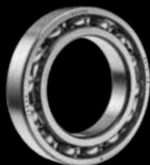
Rulmenti Radiali cu Bile

„NACHI produce rulmenti din anul 1939. Aceste componente universale au rezolvat multe probleme intr-o mare varietate de aplicatii in toata lumea”