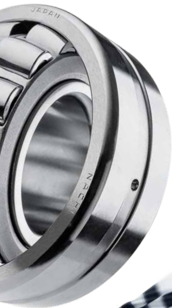
Rulmenti oscilanti cu role butoi

Clientii obtin cea mai mare fiabilitate in aplicatiile lor individuale folosind rulmenti marca NACHI.