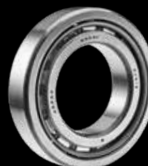
Rulmenti cu Role Cilindrice