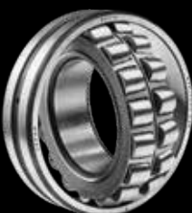
Rulmenti Oscilanti cu Role Butoi